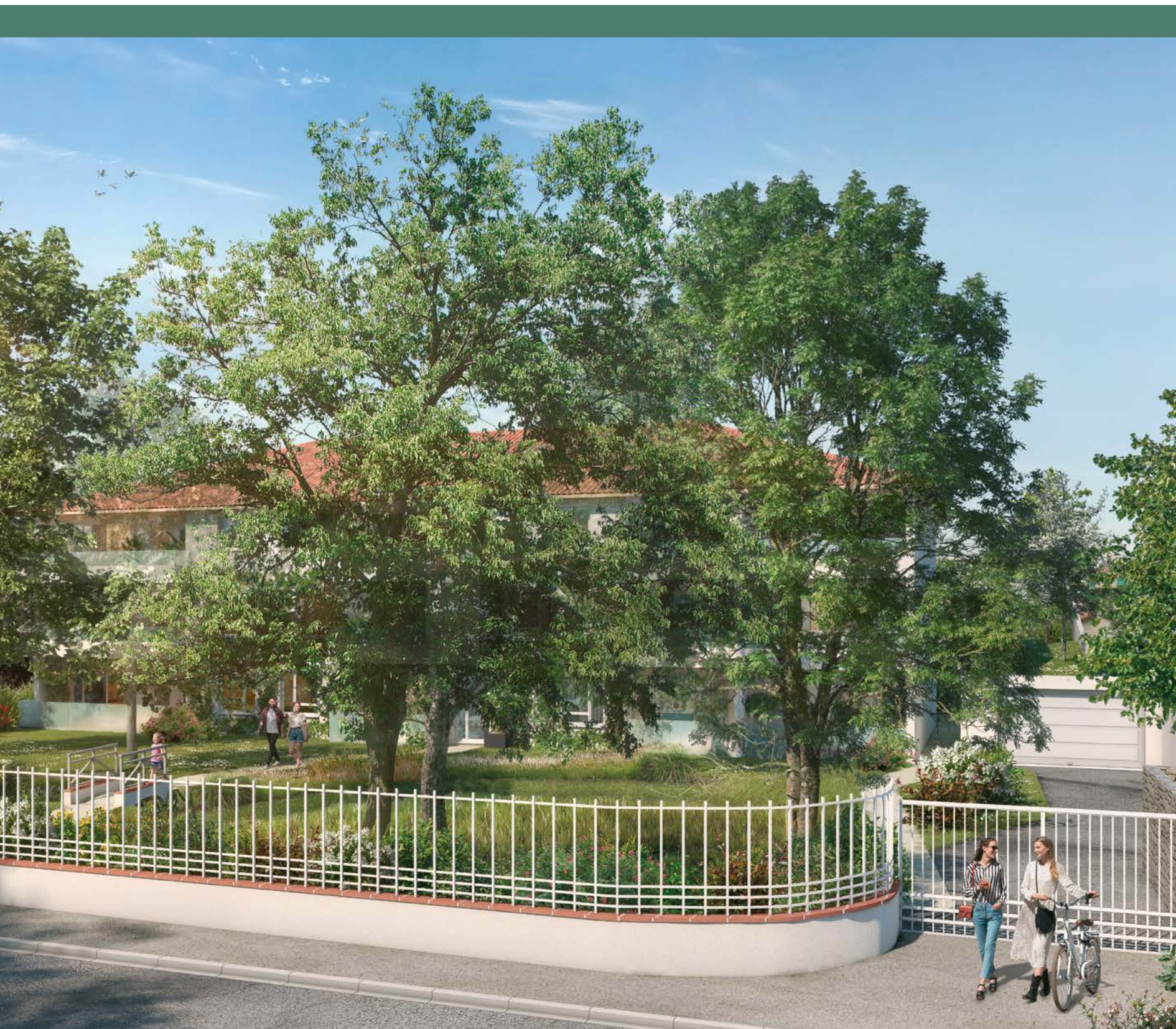
VUE CÔTÉ CHEMIN DU BLANQUET